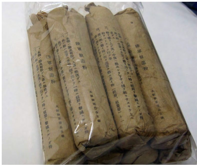
ピースあいち・メールマガジン44号 (2013年7月号) 「所蔵品より」画像 1 陸軍蚊追粉