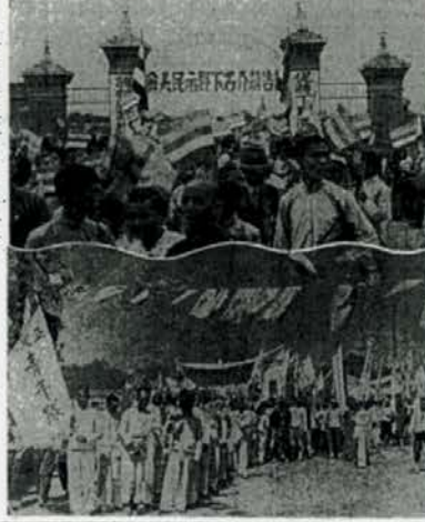
反蔣の雄叫び怒濤の如く