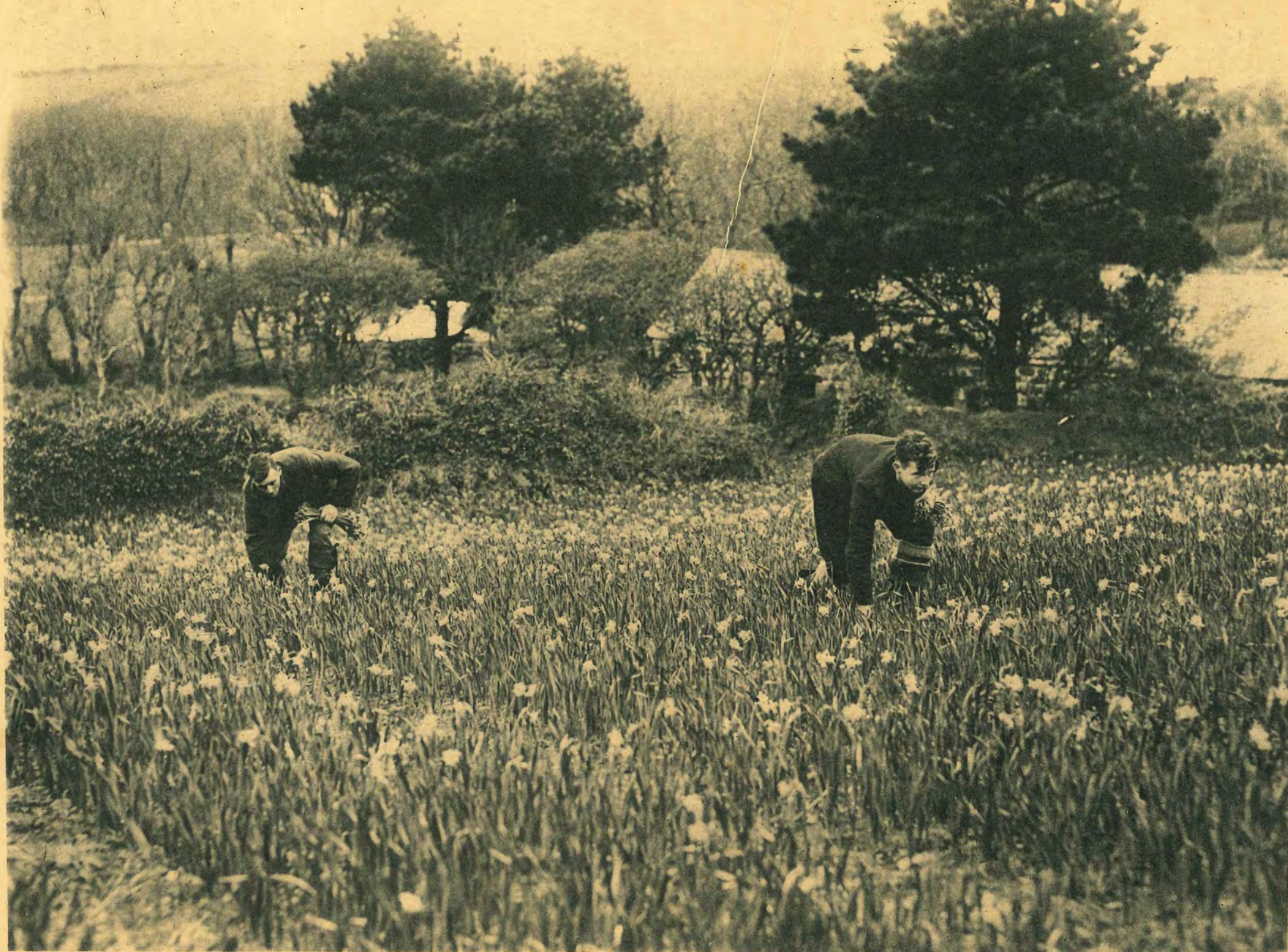
Fields rich with bloom of narcissi at Normandy.

暗雲尚消えやらの歐洲は何時人間相剋の修羅の 巷と化すやも知れず。 然しフランスノルマンディーの自然は社會葛藤をよそ に今水仙の花を惠んで平和の極。