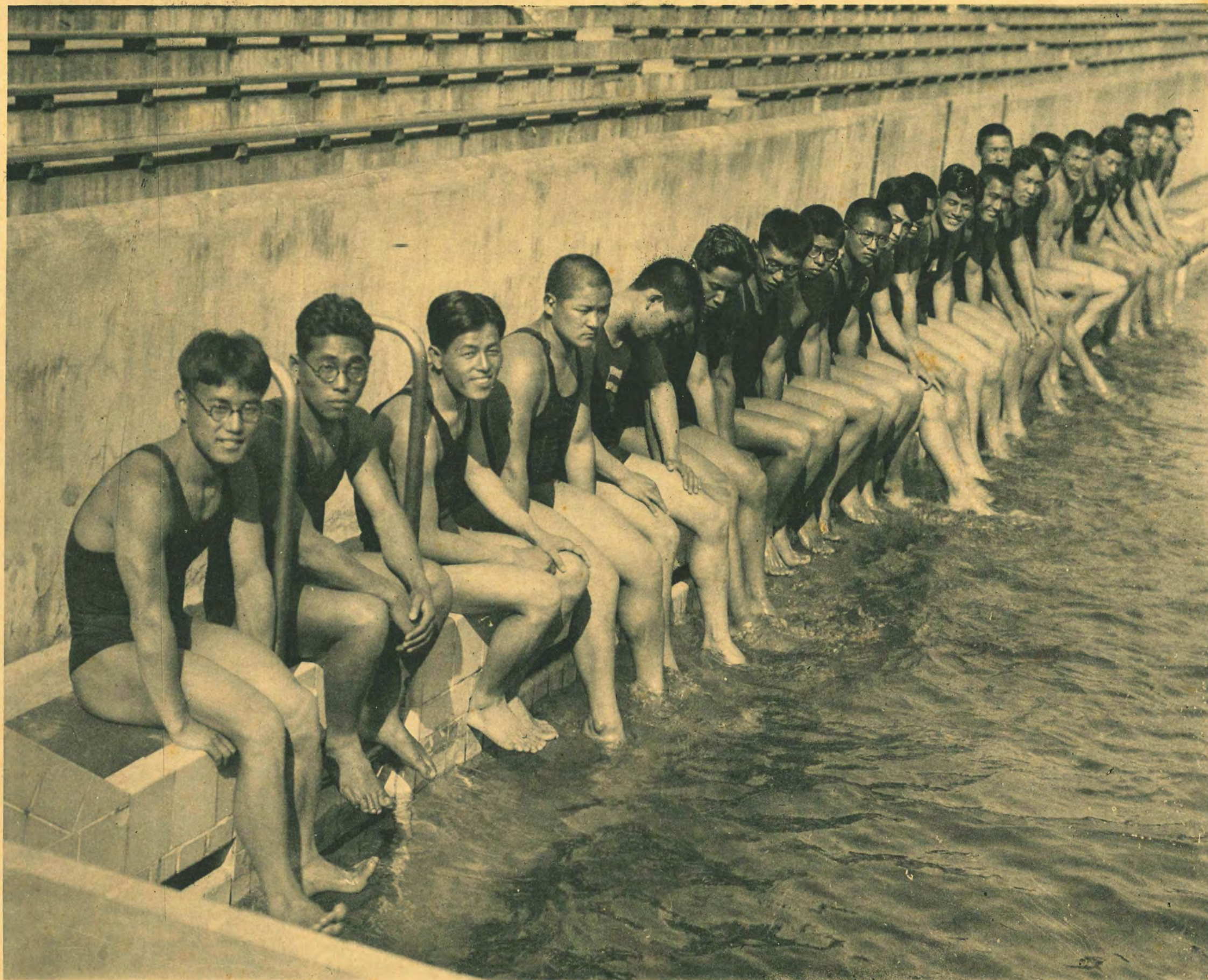
The full force of the Olympic swimming champions basking in the sun at the Meiji Shrine pool.

最終豫選で詮衡された水上日本を代表する男子競泳選手團は、愈々日本青年館に合宿、最後の猛練習を積み、ことにあつた。選手一同勢揃ひの上、軽い練習の後、プールで朗かに甲羅ほし。