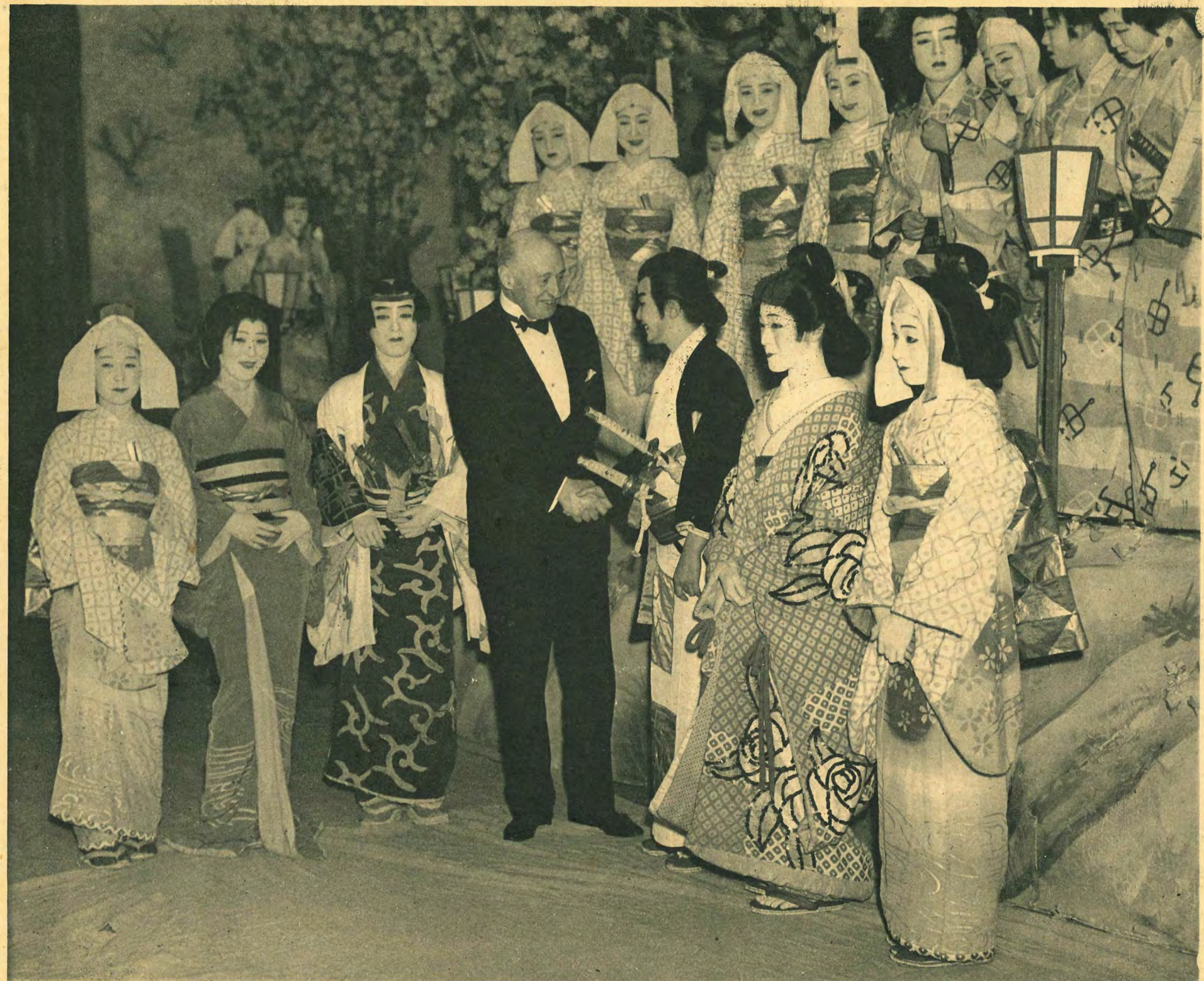
Count B. Ratzul, chairman of the Olympic Games, shakes hands with Miss Taki, a famous review girl of Syōtoku on the stage.