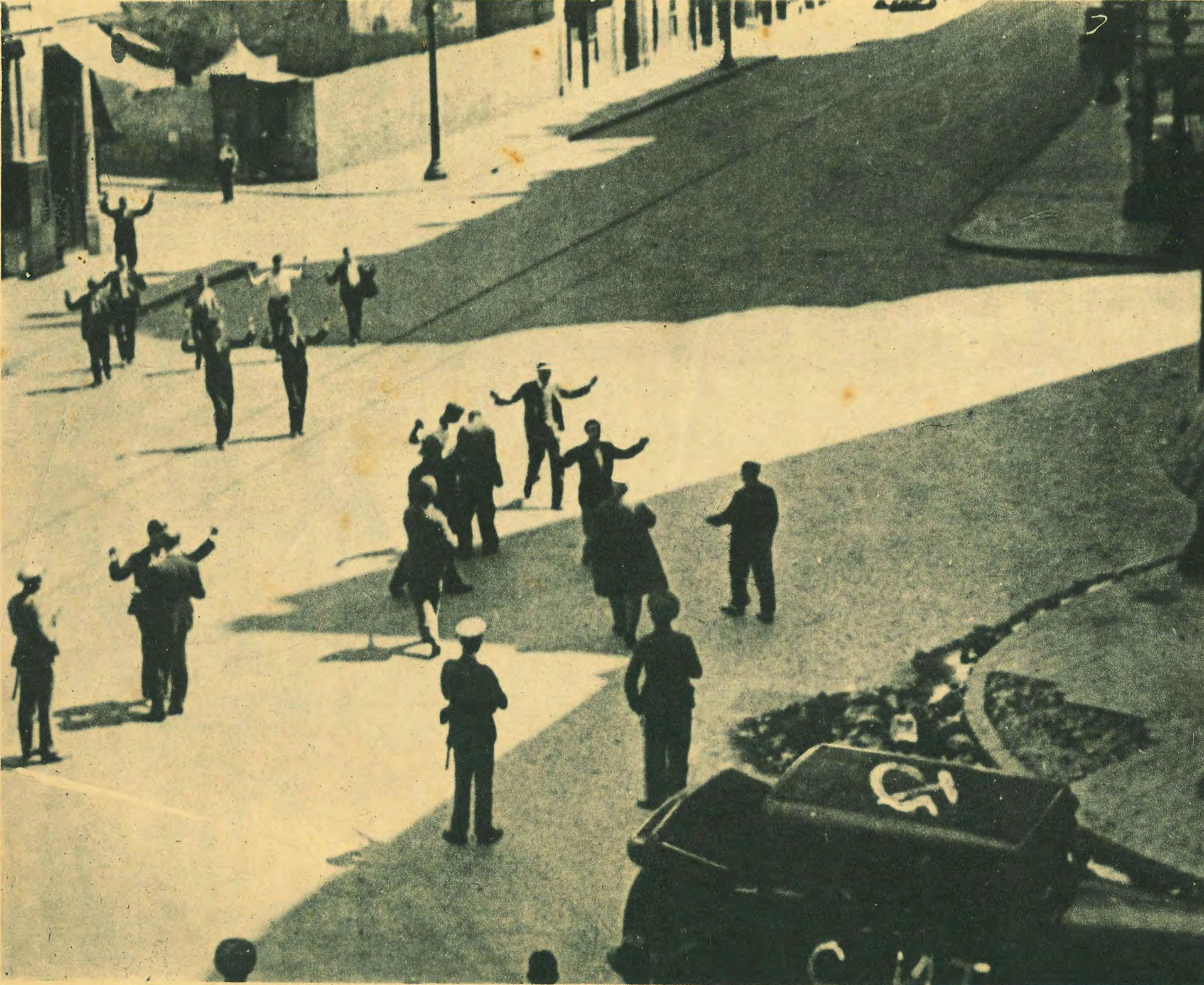
LEFTIST VICTORY AT BARCELONA IN SPAIN.

スペインの内亂は既に一ヶ月に亘らんとするも政府 叛西軍共一進一退の状態にあり勝敗の数は不明である。 唯東北カタルニア州は政府特に社會共産主義者の掌中に 握られてゐる。寫真は叛軍逮捕の政府軍バルセロナ市において。