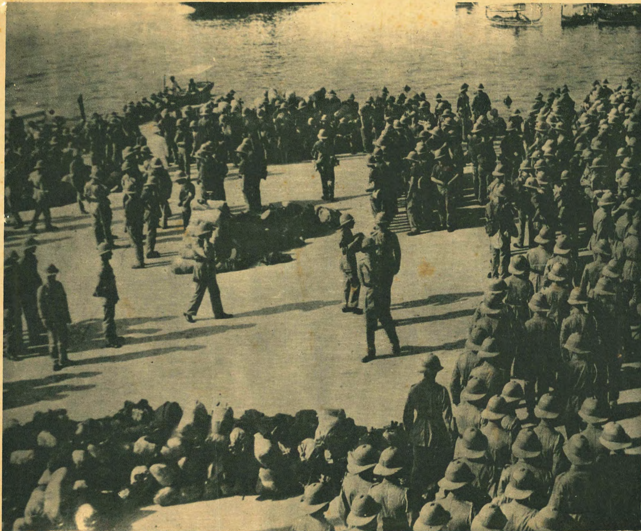
Activity of British garrisons at Malta.

既に經濟的制裁具體化し、勢のおもむくところ何時 武力断行に至るやも知れず、英地中海上の根據地マ ルタ島を守る守備隊は全兵決死の用意成る。 寫真はマルタ島守備隊の活躍。