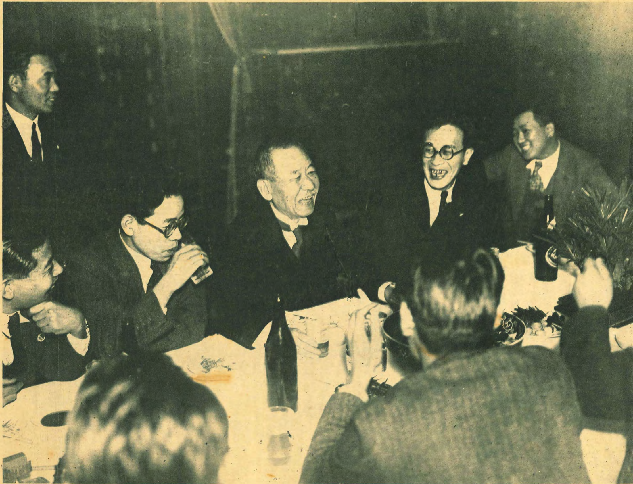
Diet remains undissolved. Photo shows Premier Ohada toasting with government officials.