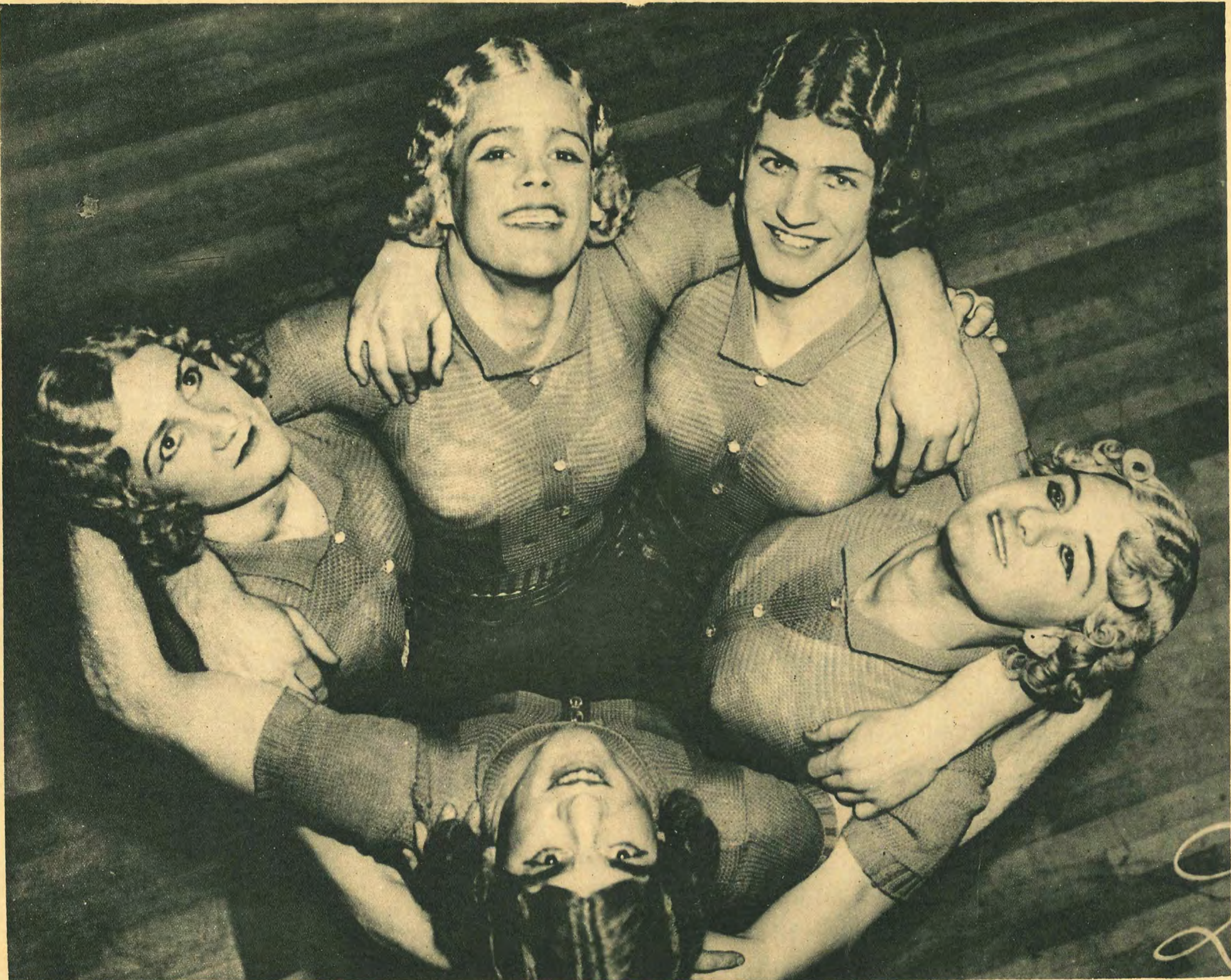
West Point Military Academy female cadets U. S.

女ながらも國防の第一線に立つて活躍すると言ふ 米國士官學校候補生の五女丈夫胸も存分にソリ上 げて意氣軒昂。 寫真ノ聯も物かほの女士官候補生。