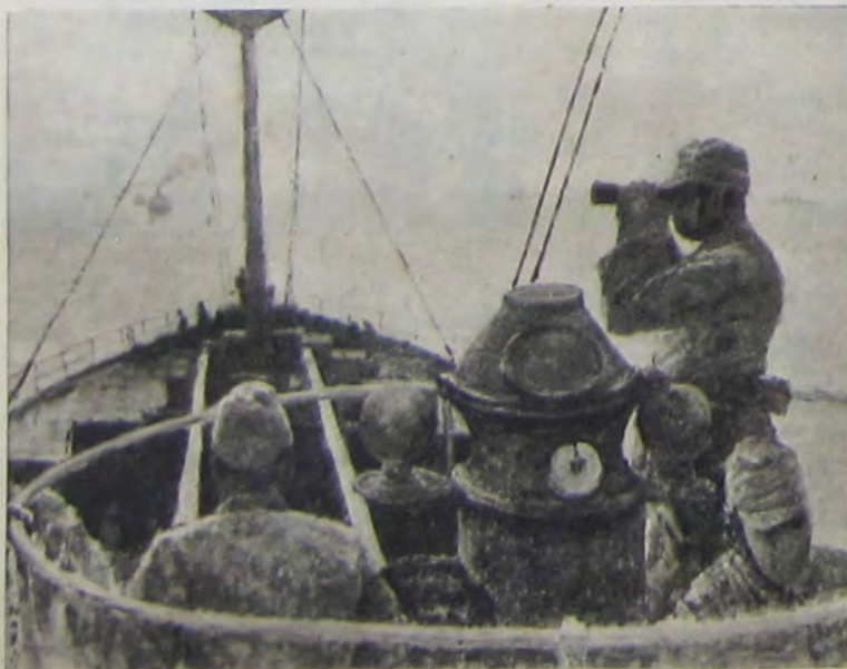
喜甚井坪 戒哨明黎