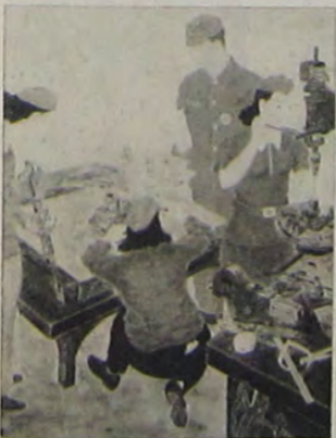
勞 動 子 女 一 揆 嵐 十 五