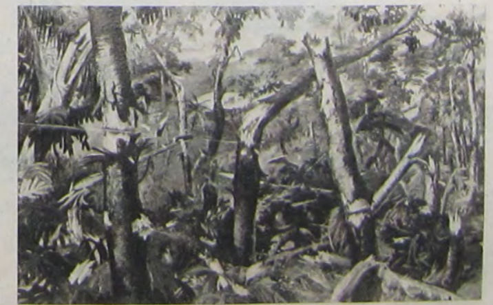
平公水三 闘戦の林那規ンパンレ