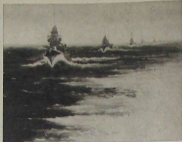
浪紫浪笠 隊戰雷水