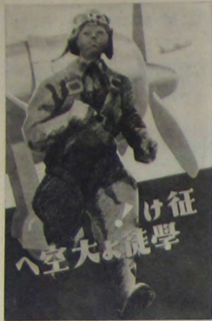
征伐學徒よ大空へ