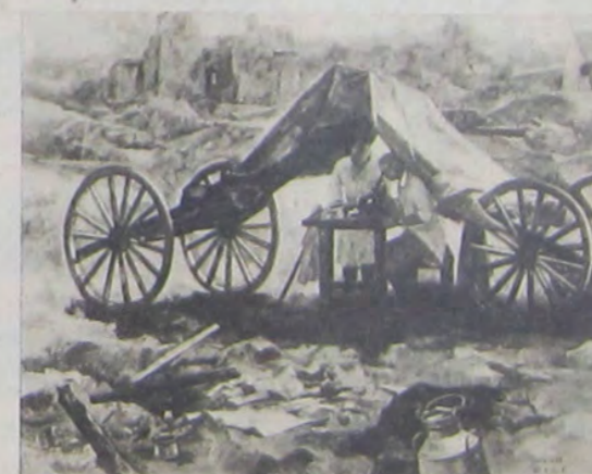
夫新木鈴 乘檢源病