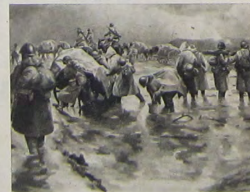
朗 澤生 間れ晴