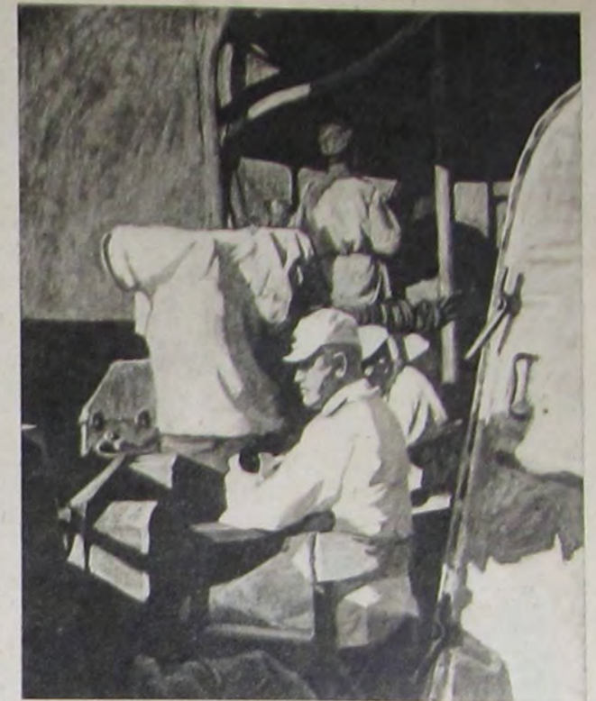
雄七三村島 督提察近ふ懸に橋艦