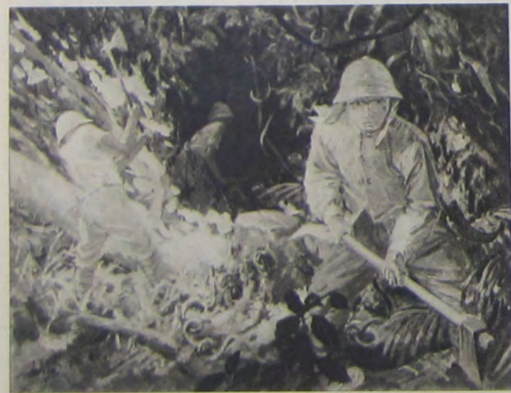
積善尾西 躍活の隊勇戦砂高