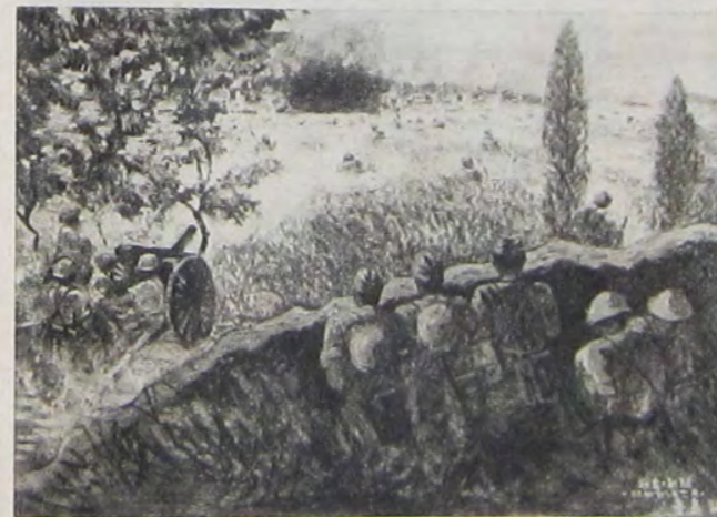
郎五祥島寺 闘戦の庄趙