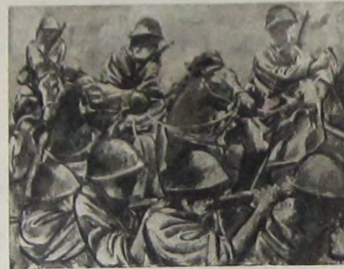
夫世間中 力協馬人