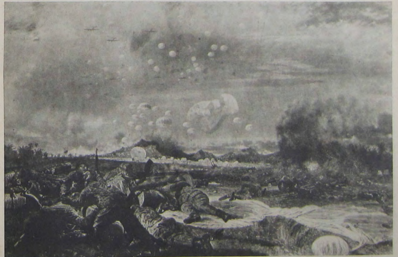
郎三本宮 國奇「ドナメ」隊部傘下落軍海