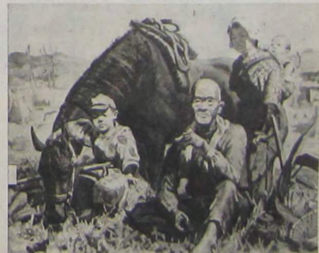
雄 文 口 關