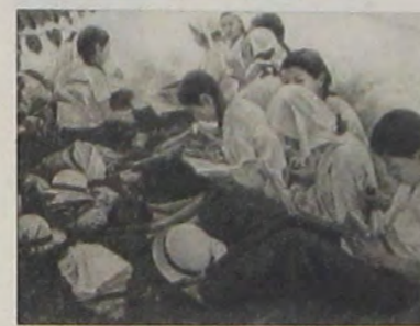
勤勞奉仕隊の午食