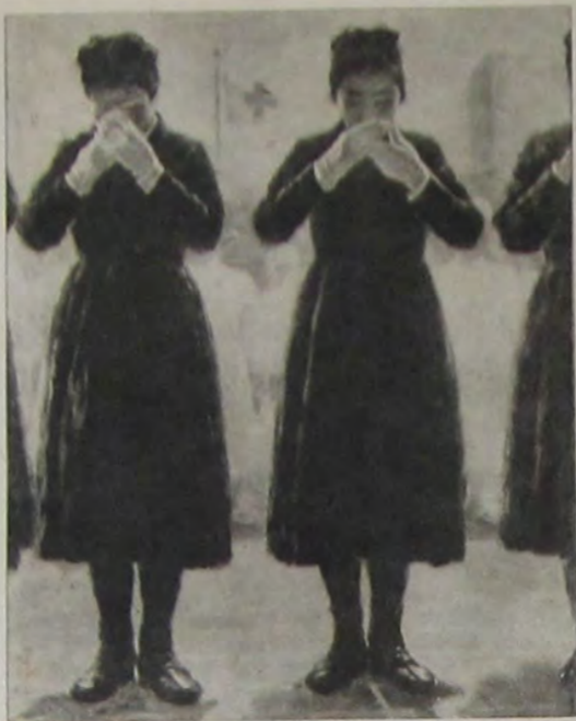
實 津 赤 日 く 征