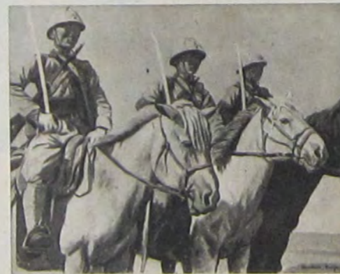
三健原楢 (隊兵騎安興古蒙) に共と軍皇