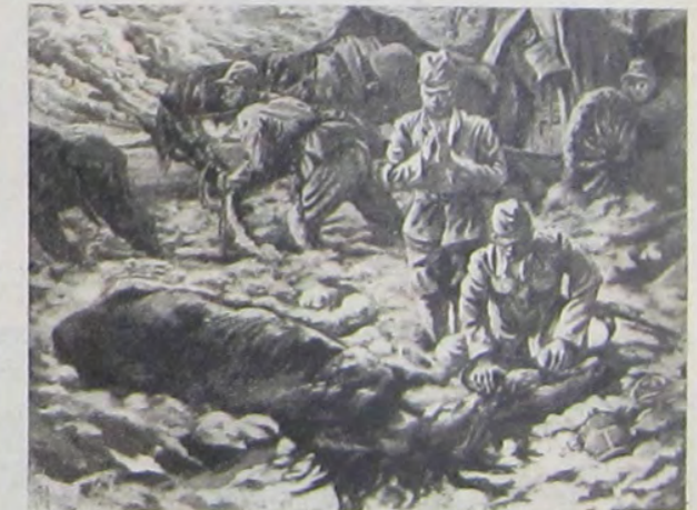
男士富下丹 うたがりあよ青