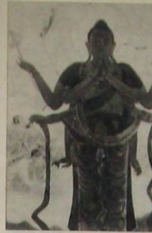
(く傳に靈英) く生に天魂 司量所田