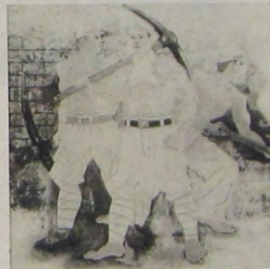
魁 三 山 村 儼