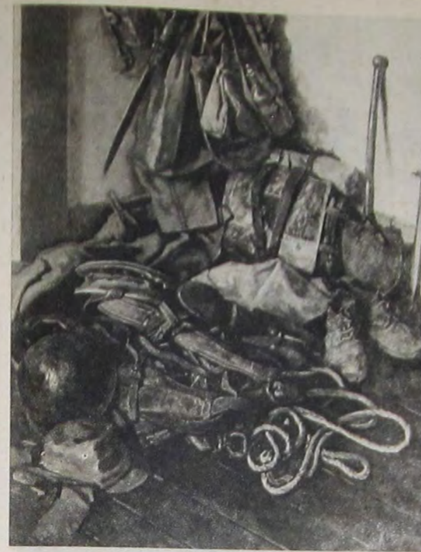
郎四龍尾藤 (物静の他其服被) 具 姿