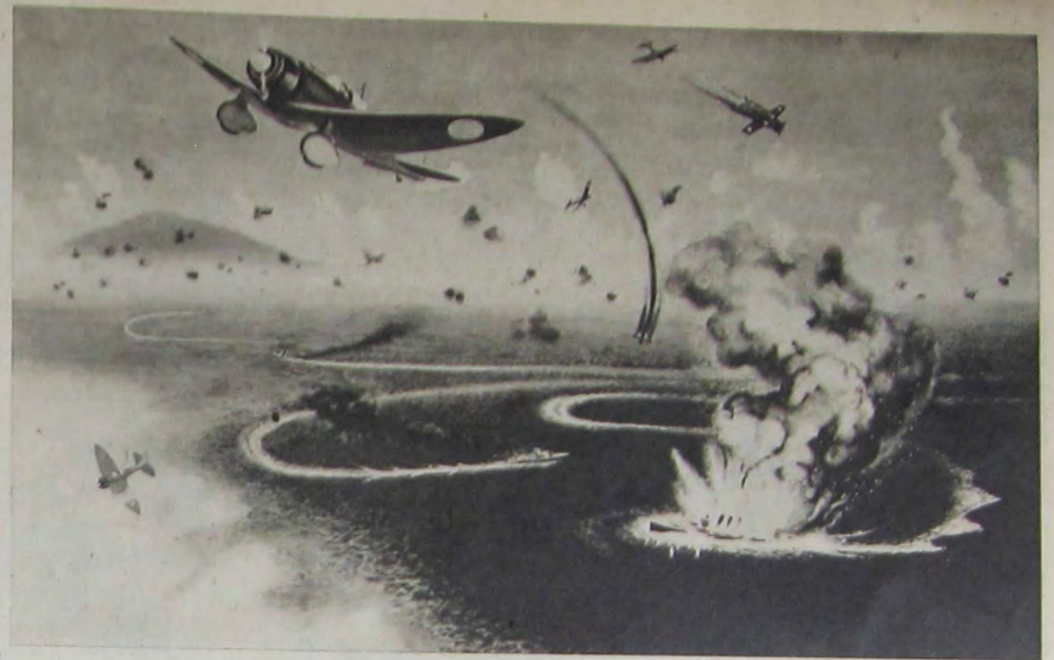
「イサベル」島沖海戦 小堀安雄