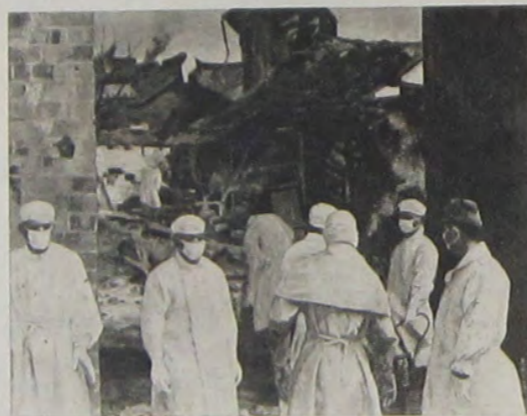
郎一光松若 班疫防軍陸