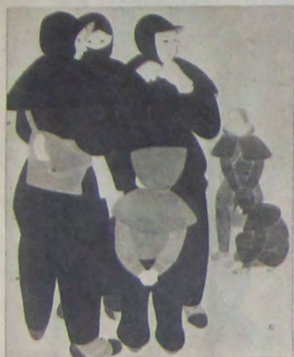
伊藤藤乙 櫻 待