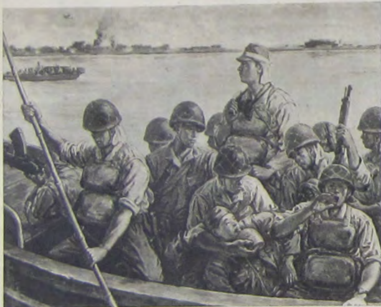
喜廣名川 圖戦進臺湖庭洞