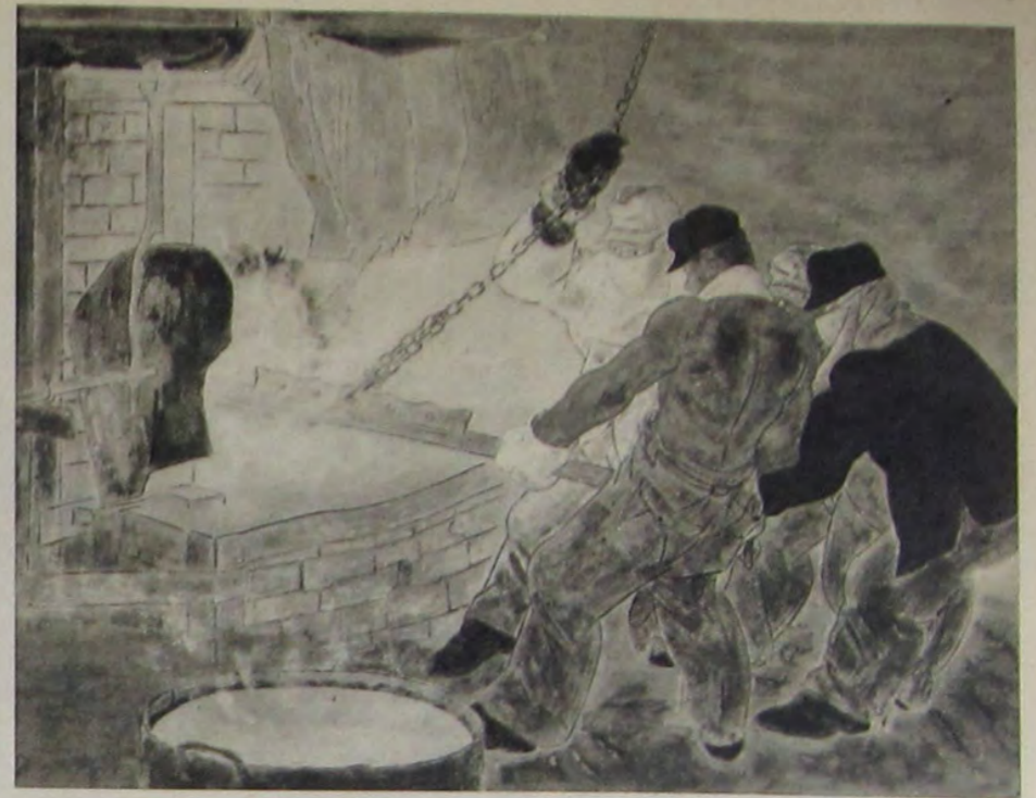
明 昂 口 野 關 炎