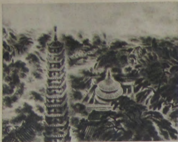
木村村舎 德 承