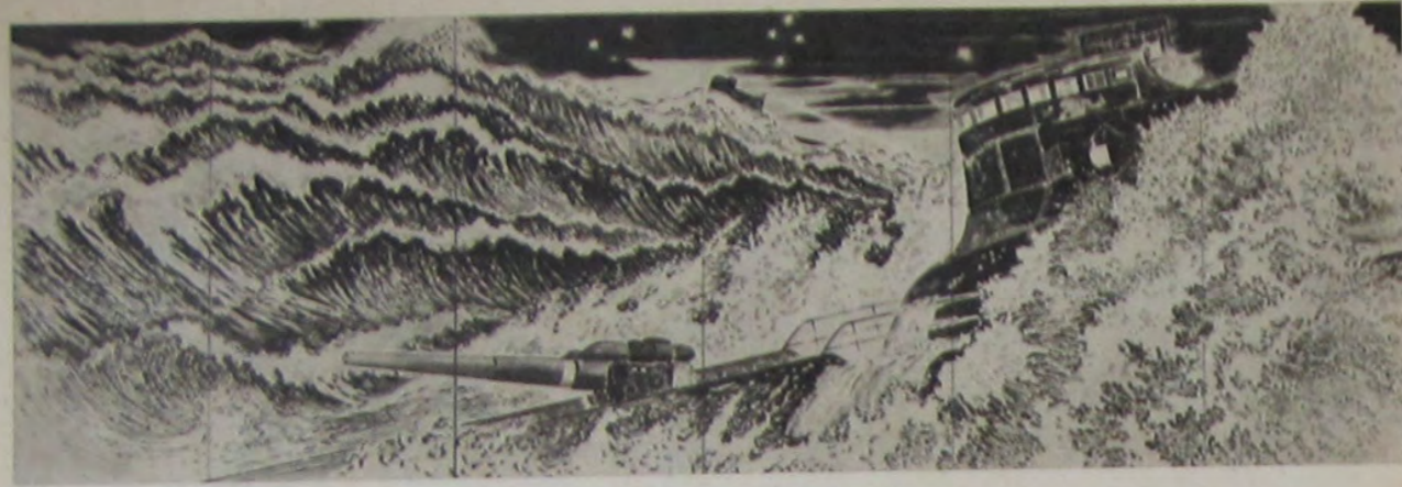
風形木 葵 撃出の艦水潜