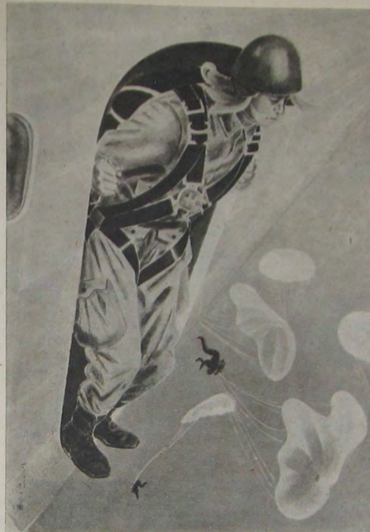
神兵下降 福田豊四郎 友三 松孝 戰