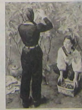
る 採 を 賣 の 麻 苧