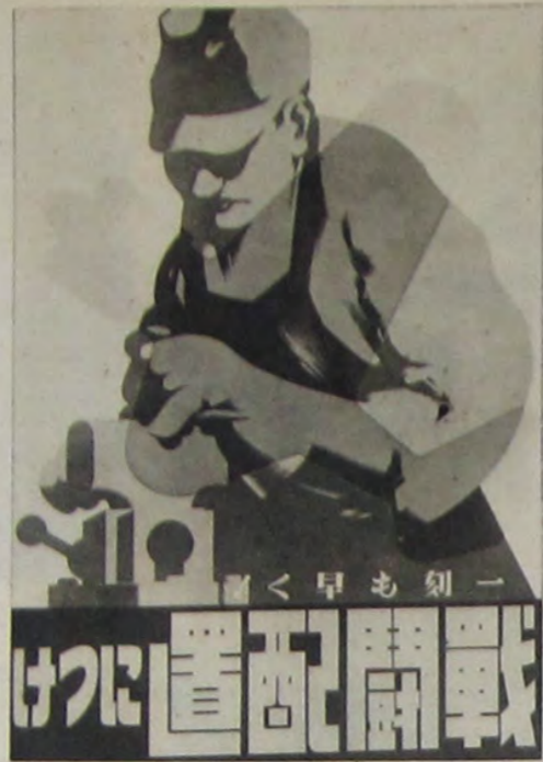
總動員戰闘配置につけ