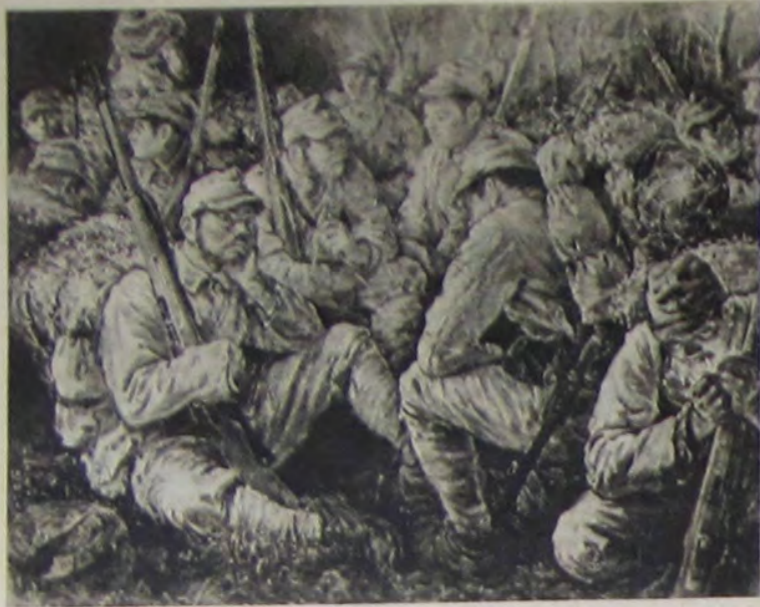
郎五八村辻 夜 薄