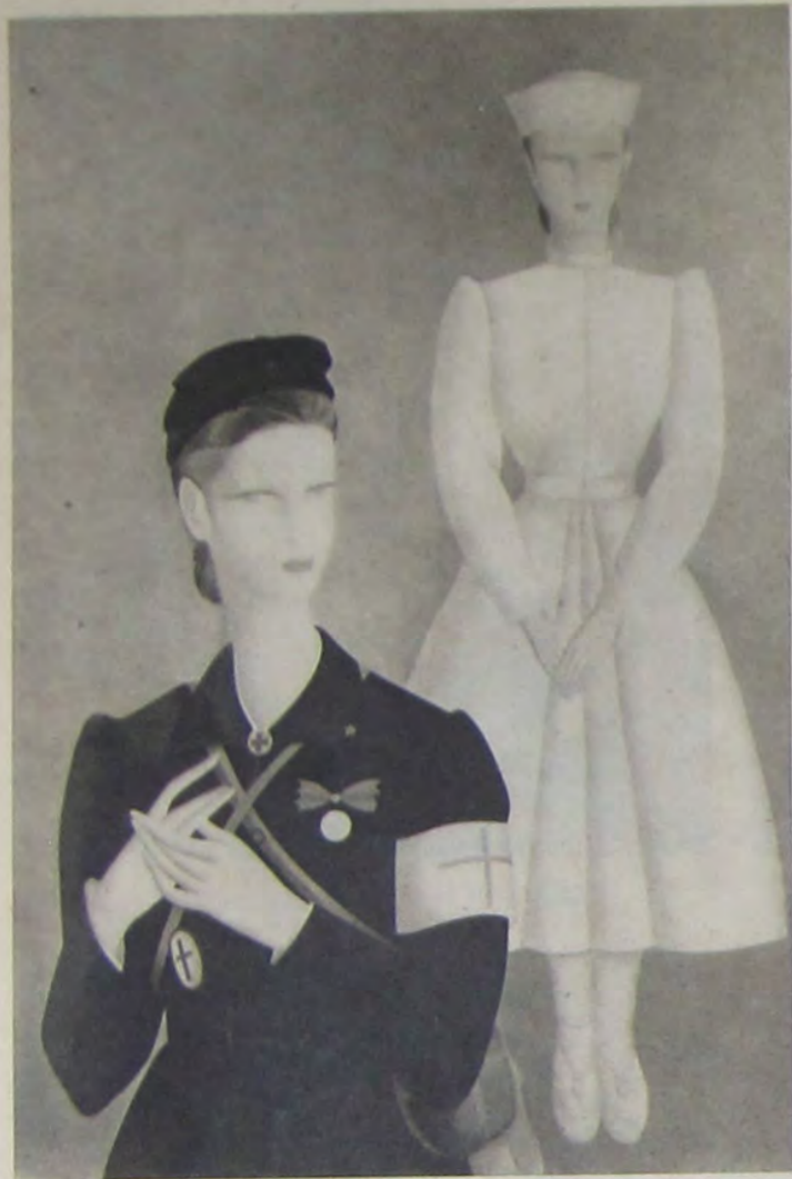
兒青郷東 醫 出