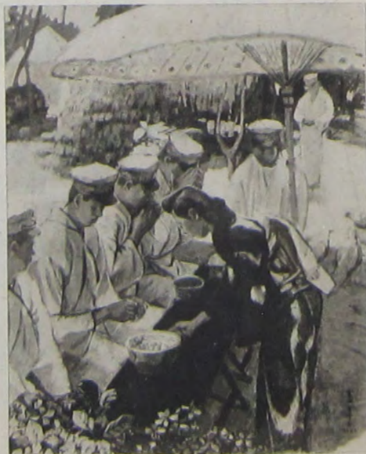
彦 份 永 宮 問 慰 て た の