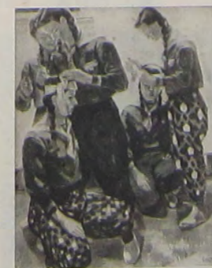
習 自 の 後 銃