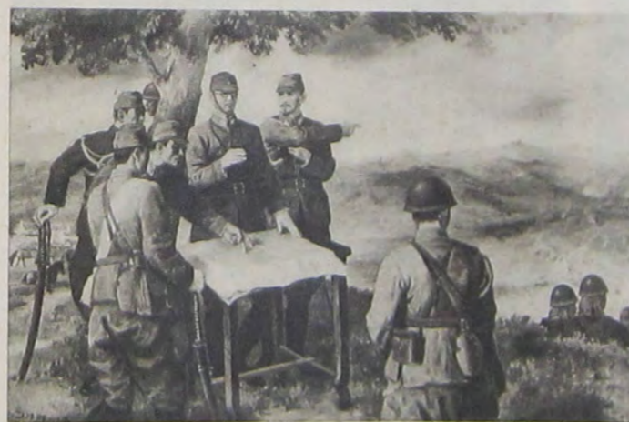
良士子日本山 長團兵井百故るす揮指を闘戦の面方総團