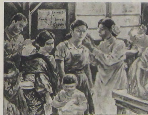
美 沢 野 高