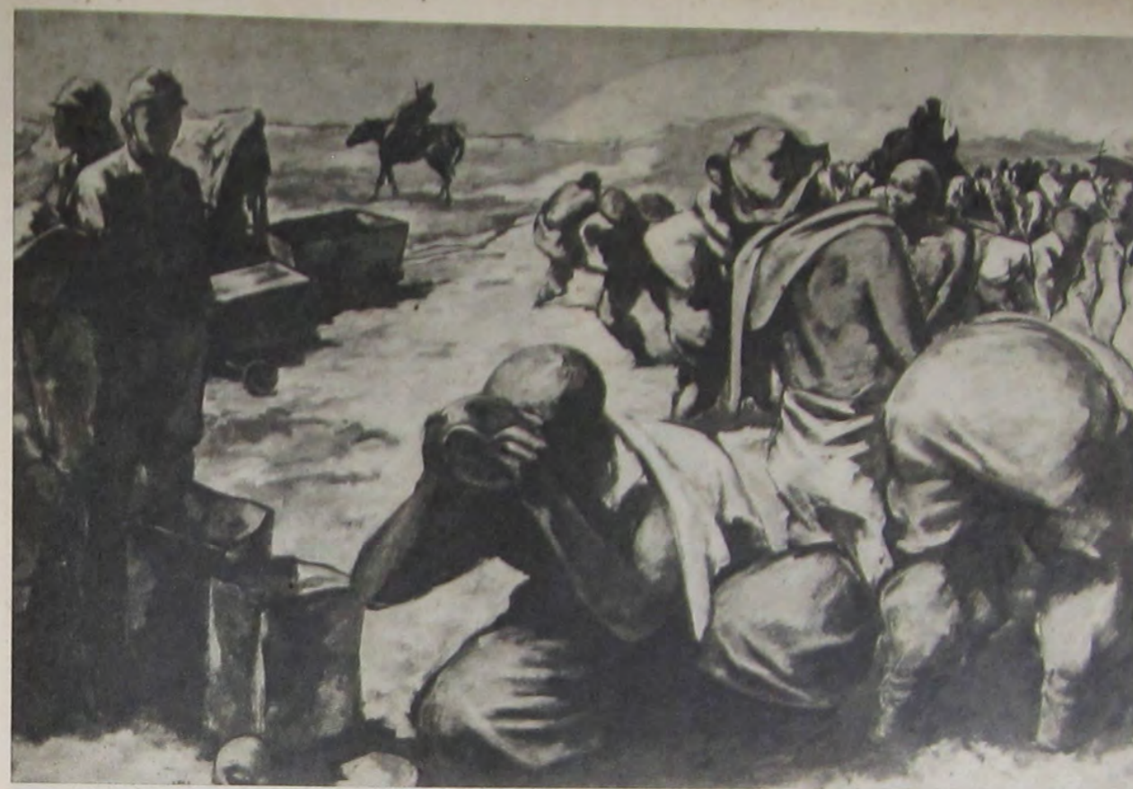
嶺 山 中 (支北) 設 建 路 鐵