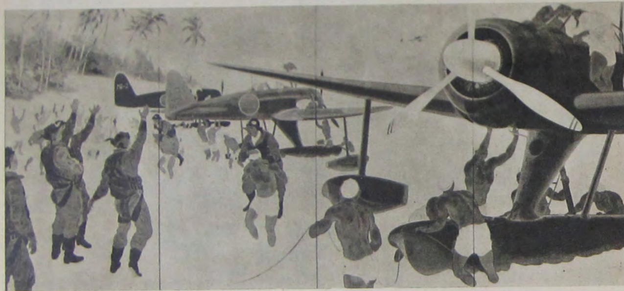
楊華口山 業作備整るけに地基