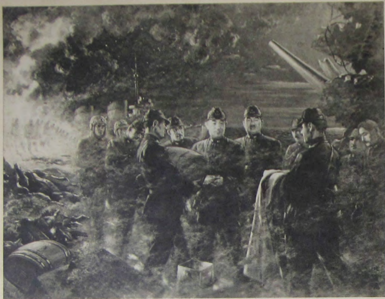
北 運 藏 提督の最期