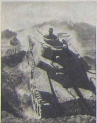
兵車戦年少ふ盛に士富