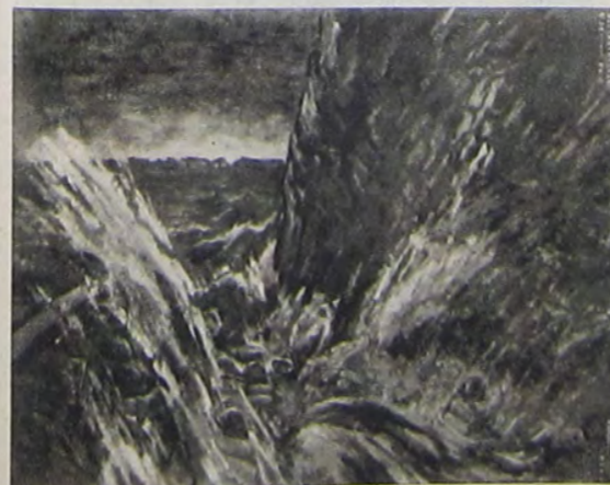
郎三浦染 保獲田油隊部岡