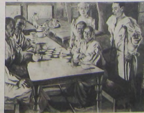
宏嘉下武 後の練訓