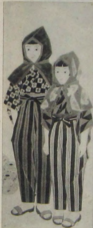
民 榮 田 上 邊 待