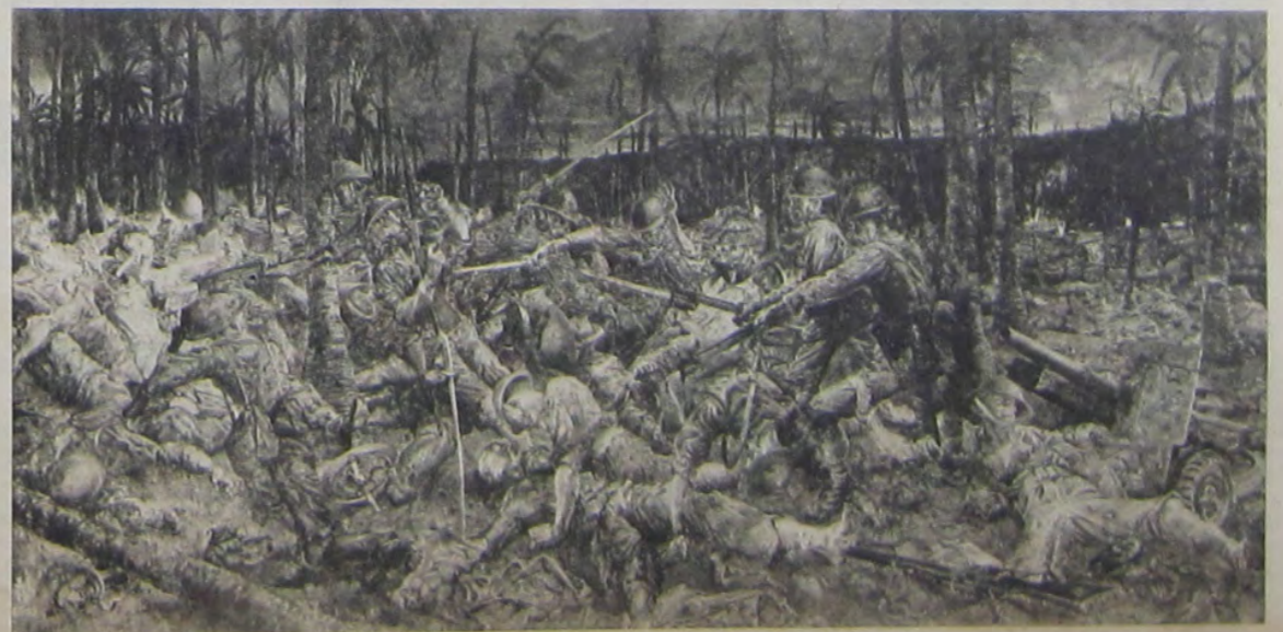
〇〇部隊の死闘「ニユーギニア」戦線 藤田嗣治