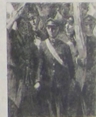
陣 出 徒 學