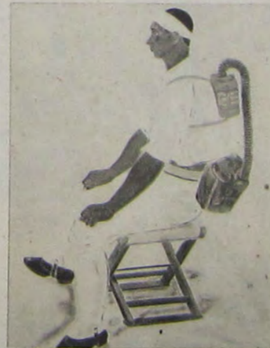
櫻 待 市 亮 岡 光