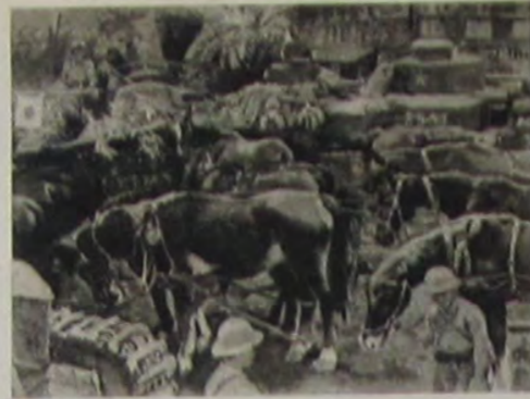
次高川西 車戦と馬