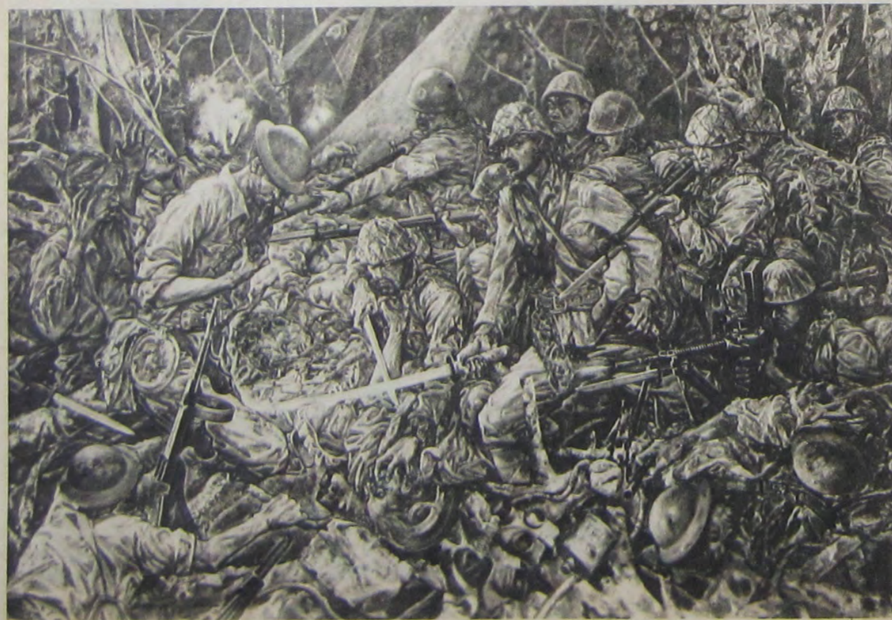
佐 藤 敬 密林の死闘 [「アニキユニ」]